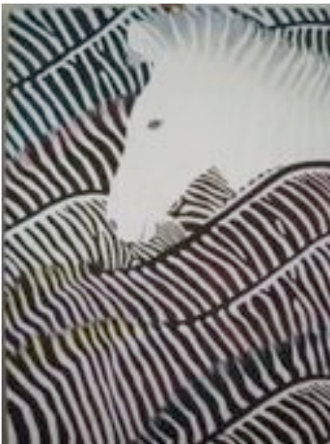
Seepra ilman raitoja 120x80 cm, öljy Krisse