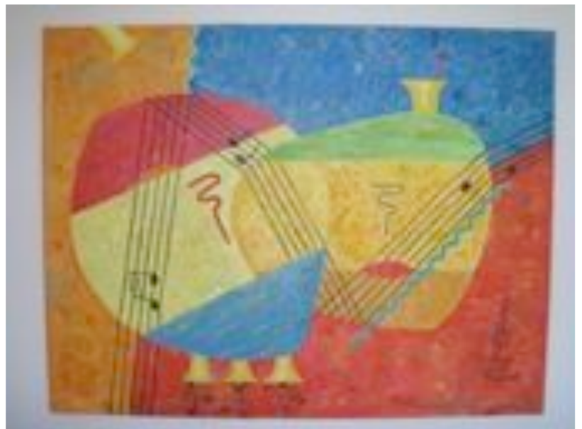
K&D&Musiikki 130x170 cm öljy Krisse