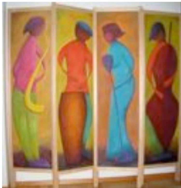
House Band, neljästä erillisestä hahmosta tehty särmi 180 x 160 cm, öljy, Krisse