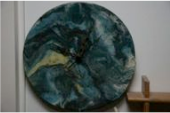
Työväenopiston Nerikomi-kurssilla tehty "marmorikello". Pertti