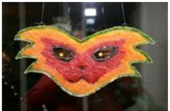
Työväenopiston Pate dé Verde -kurssilla tehty ikkunakoriste. Pirjo