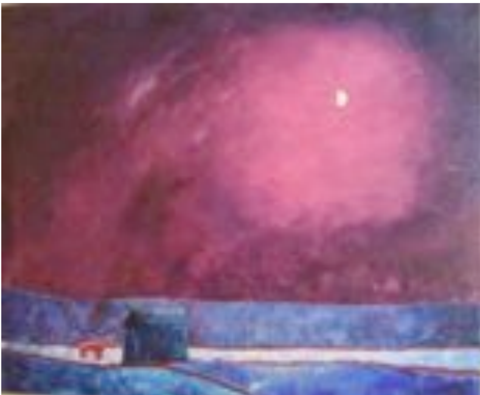
Talvi - Pyhä hetki