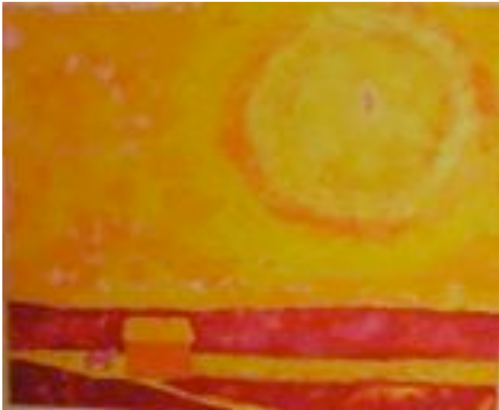
Kesä - Elämän hehku