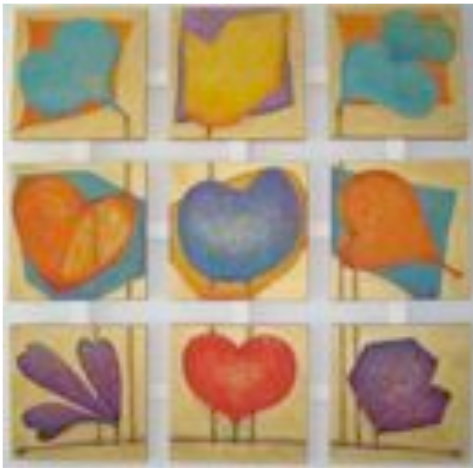
Kaiken keskellä on sydän koko 9x30x30 cm, öljyvärei Krisse