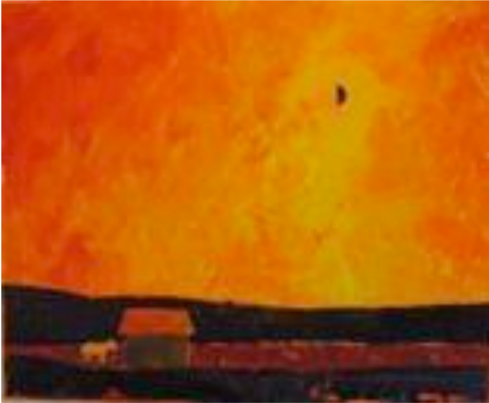
Syksy - Kohti oranssia

Tässä sarjassa valitsin yksinkertaisen kuva-aiheen ja aloin tutkia värien vaikutusta kuvan tunnelmaan. Otin myös huomioon väriyhdistelmien symboliset merkitykset. Jossain vaiheessa sarja alkoi kuvastaa eri vuodenaikoja. Kevään hempeydestä kesän riemun ja syksyn oranssin kautta talven hiljaisuuteen. Kuten luonnon kiertokulussa myös ihmisen elämänsäkaressa kuljemme tätä samaa polkua.