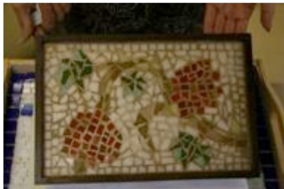
Tarjottimien uudet ilmeet Krisse