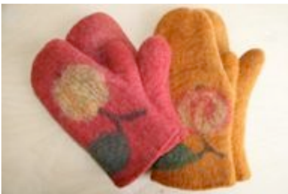
Huovutetut uunikintaat. Kisse