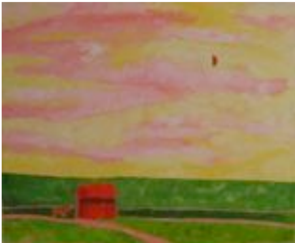
Kevät - Rakkauden talossa