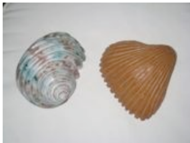
Keramiikkaa, työväenopiston 5 v. kurssi,