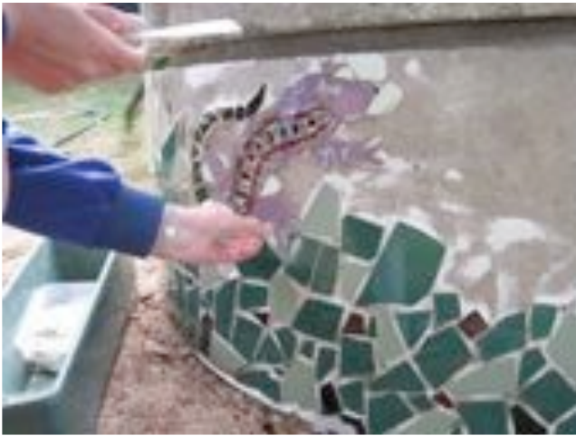
Mökkikaivon uusi ilme, rikotusta keraamisesta laatasta tehty mosaiikkipinta Krisse