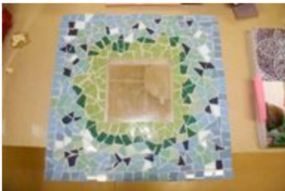
IKEAn peilin uusi ulkonäkö mosaiikki, Riitta

Riitta maalaamassa viimeiseksi jäänyttä maalaustaan "kerro se kukkasin". Ikään kuin hän olisi jättänyt jäähyväiset kukkien välityksellä.