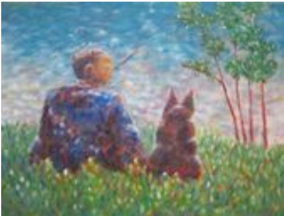
Impressionistinen työ Mies ja koira ongella

Monelle ryhmän maalarille omin tyyli on esittävä ekspressionismi, joka kehittyi tyyli-suuntana impressionismin jälkeen. Siinä kun impressionisti maalaa havainnoimalla ulkoista maailmaa, ekspressionisti maalaa ikään kuin sisältäpäin pyrkien tuomaan esille oman sisäisen kokemuksensa kohteesta. Näköisyys ei ole tällöin niinkään tärkeä, vaan oma sisäinen näkeminen ja kokeminen. Ekspressionistisia töitä ovat lehdesämme Ilkan "Metsä", jossa pyritään abstrahoimaan metsän tuntua ilman, että mallina olisi maisemaa tai edes valokuvaa metsästä.